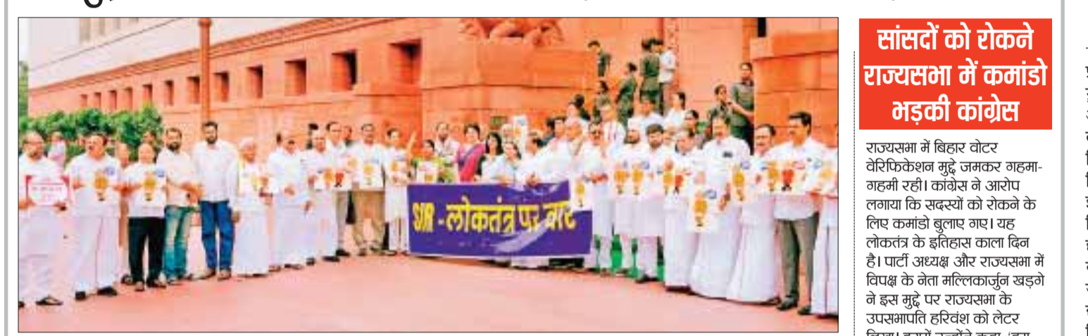
एजेसी नई दिल्ली

संसद का मॉनसून सत्र बिहार में मतदाता सूचियों के विशेष गहन पुनरीक्षण (सर) के मुद्दे पर पूरी तरह से घुलता दिख रहा है। ऑपरेशन सिंदूर पर चर्चा को छोड़ दें तो संसद में कामकाज पूरी तरह से ठप है। शुक्रवार को लगातार नौवें दिन विपक्षी सांसदों ने सर पर चर्चा की मांग को लेकर संसद के बाहर प्रदर्शन किया। संसद के अंदर भी यह विरोध प्रदर्शन जारी रहा और कार्यवाही फिर ठप हो गई। मॉनसून सत्र की शुरुआत 21 जुलाई को हुई थी और शुक्रवार को सदन की कार्यवाही का 10वां दिन है। सदन में इस दौरान